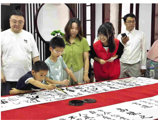
上图为河北大学莲池书院志愿队在古莲花池开展的志愿服务活动。

“2024年，我们用行动传递温暖，用爱心点亮希望。一个个蓝白身影，一场场志愿活动，成就无数感动的瞬间。感谢每一位志愿者的无私奉献！2025，我们继续同行！”这是河北大学青年志愿者新学期新的誓言。回望2024年，西部计划、研究生支教、红石榴志愿者……河北大学的青年始终走在志愿前线，为社会服务，为温暖前行。