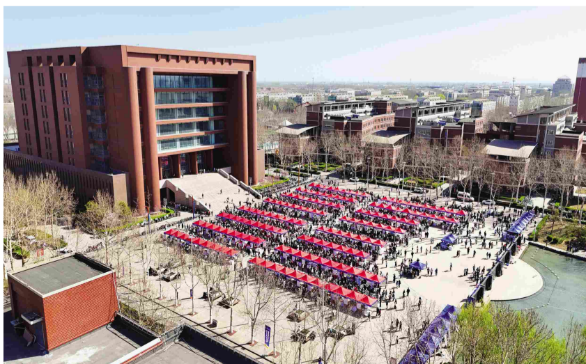
本报讯 3月22日,第十三届京津冀招才引智大会在我校举办。本次大会以“才聚京津冀,共同向未来”为主题,由京津冀人社部门共同主办,我校为协办单位。大会

共组织京津冀及雄安新区375家优质用人单位线上线下参会引才,发布人才需求岗位1.1万余个。用人单位收取有效简历33657份,5700余人次达成初步就业意向。