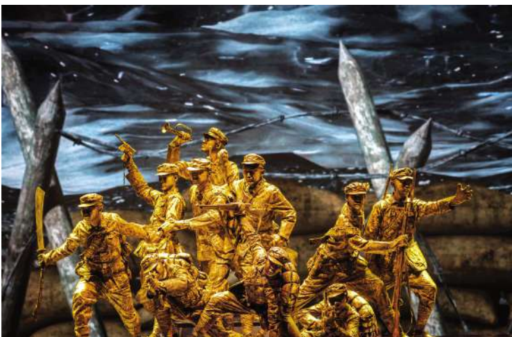
榜样凝聚力量，奋斗成就梦想。我校参演的情境音诗画《英雄赞歌》再现了华夏英雄的无畏姿态。

2021年五四青年节特别节目以“奋斗正青春”为主题，节目摹画出当代青年勇立潮头争做先锋的担当，披荆斩棘勇敢拼搏的信念，以及朝气蓬勃活力无限的风采，共同构成了一幅色彩缤纷的新时代青春画卷。