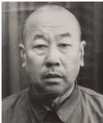
裴学海(1899—1970),语言文字学家。河北省滦县人。

据说,裴学海先生来河北大学工作与郭沫若有关。《滦南人物》一书中的词条这样说:“解放初期,郭沫若到天津讲学,讲学前问:‘裴学海来了没有?他在天津只教中学,你们要是不用他,科学院请他去。’经郭老举荐,裴先生从天津六中调到天津大学(河北大学前身)中文系。1954年他任天津师范大学(后更名河北大学)中文系讲师,1959年晋升为副教授,曾任河北大学中文系古汉语教研室主任。”