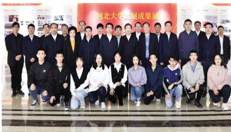
王东峰与河北大学师生代表亲切交流并合影

表交流时,王东峰代表省委、省人大常委会、省政府、省政协,向河北大学即将迎来100周年校庆表示热烈祝贺,向河北大学广大师生表示亲切慰问。王东峰指出,河北大学建校100年来,始终坚守家国情怀,紧紧围绕国家和民族之需,推出了一大批研究成果,培养了一大批优秀人才,为我国教育事业作出了积极贡献,为河北改革发展发挥了重要作用。要持续巩固拓展百年丰硕成果,在新时代继续改革创新,努力取得更大成就。