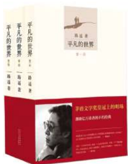
《平凡的世界》 路遥 著

深纠缠的故乡情结和生命的沉重感去感受生活，以陕北大地作为一个沉浮在他心里的永恒的诗意象征，每当他的创作进入低谷时，他都是一个独自去陕北故乡的“毛乌素沙漠”，他在那里审视自己，观照社会。