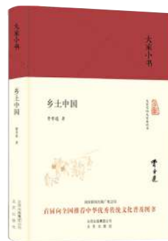
《乡土中国》 费孝通 著

久居城市，未曾亲身涉足乡村。然而此程跟随《乡土中国》里的文字，我却直入乡土社会富有内涵的人文世界，透视了属于这淳朴民风最深层的内容。