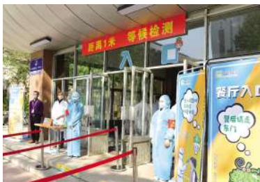
食堂门口观看就餐提示,测温进入食堂