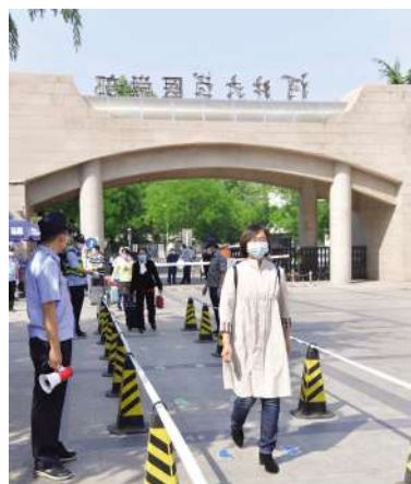
保持距离进入校园内体温检测点