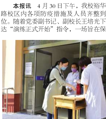
保持一米间距排队进入学生公寓,核实学生信息,测体温