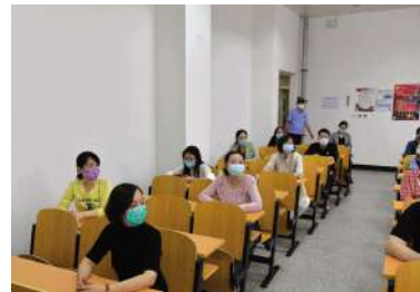
教室听课保持间隔距离