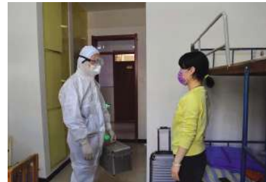
模拟学生宿舍发热患者应急处置